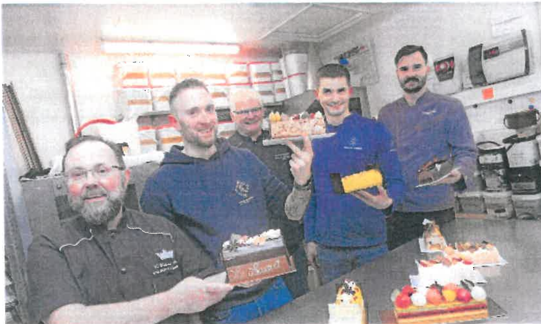
Les pâtisseries de Loir-et-Cher rivalisent d'ingéniosité pour proposer les meilleures bûches de Noël.