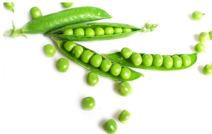
LES PETITS POIS