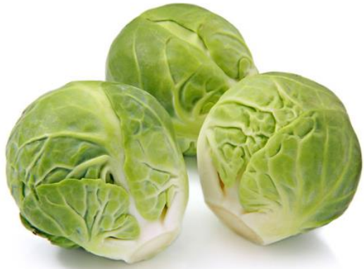
LES CHOUX BRUXELLE