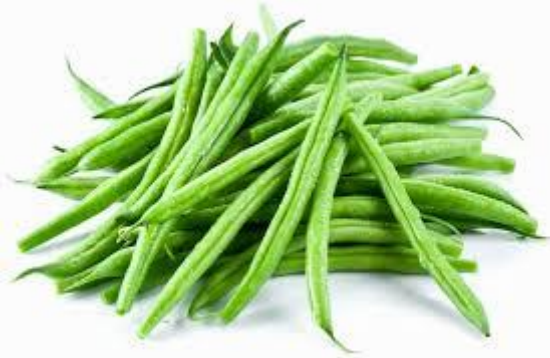
LES HARICOTS VERTS