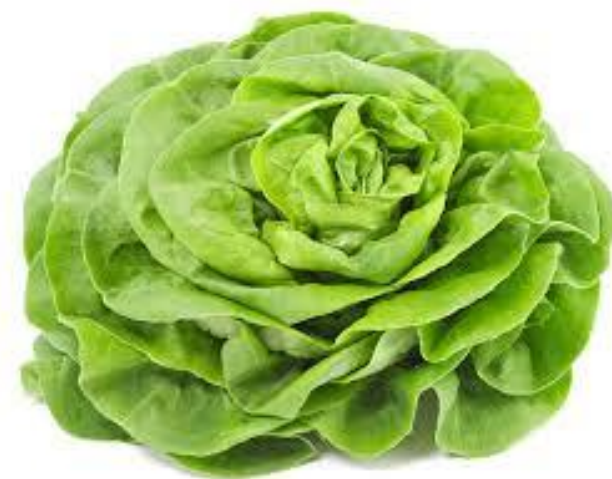
LA SALADE VERTE