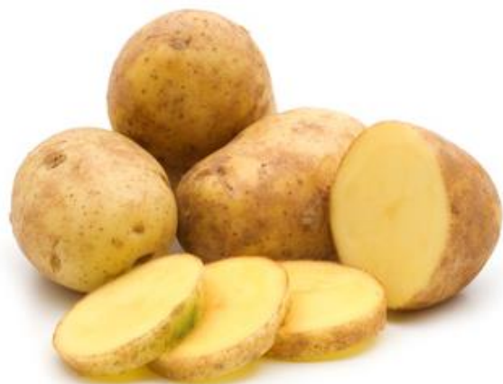
LES POMMES DE TERRE