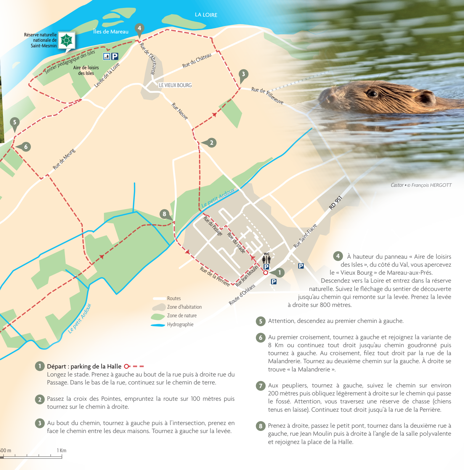
Castor • © François HERGOTT