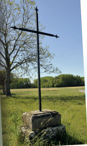
La croix des Pointes

Après le Val, ses cultures et ses arbres fruitiers, la Loire apparaît, majestueuse et sauvage. Au fil du sentier, l'histoire de Mareau-aux-Prés vous est racontée à travers les noms évocateurs des hameaux que vous traverserez : le Vieux Bourg, la Malandrierie et le Trépoix.