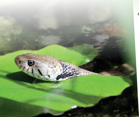
Couleuvre à collier