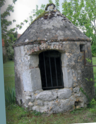
Le puits de Rolland