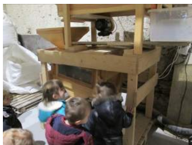
Visite de Moulin, Huisseau-sur-Mauves (22 et 29 mars 2019)