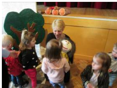
Spectacle Miam-miam, Meung-sur-Loire (26 février 2019)