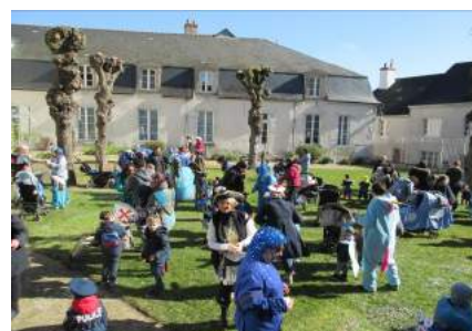
Le Carnaval en Bleu, Meung-sur-Loire (19 mars 2019)